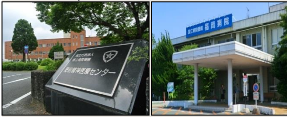
肥前精神医療センター

依存問題でお困りの方、ご家族、 職場関係の方… 専門のスタッフがご相談を お受けいたします。